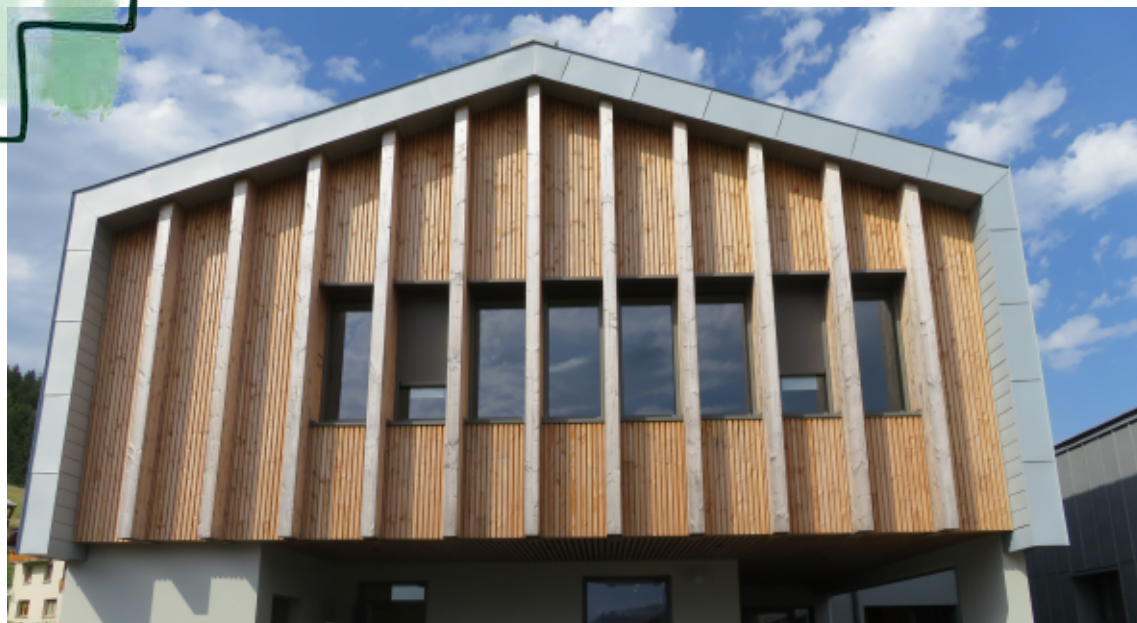
Groupe scolaire - Bois d'Amont (Jura) - AUM Architectes Essences mises en oeuvre : épicéa, sapin, douglas Volumes : 720 m 3 de billons, 133 m 3 de sciage, 155 m 3 de produits finis Mise en service : 2023

Toutes les communes qui ont achevé une construction intégrant du bois de leur forêt sont fières tant de leur engagement que d'avoir généré une chaîne de valeurs techniques et économiques conjuguant les savoir-faire des entreprises et les compétences des équipes de maîtrise d'œuvre, sans induire un écart de prix significatif par rapport à un projet classique.